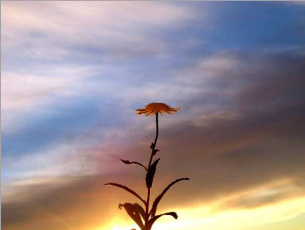
Pogled v nebo