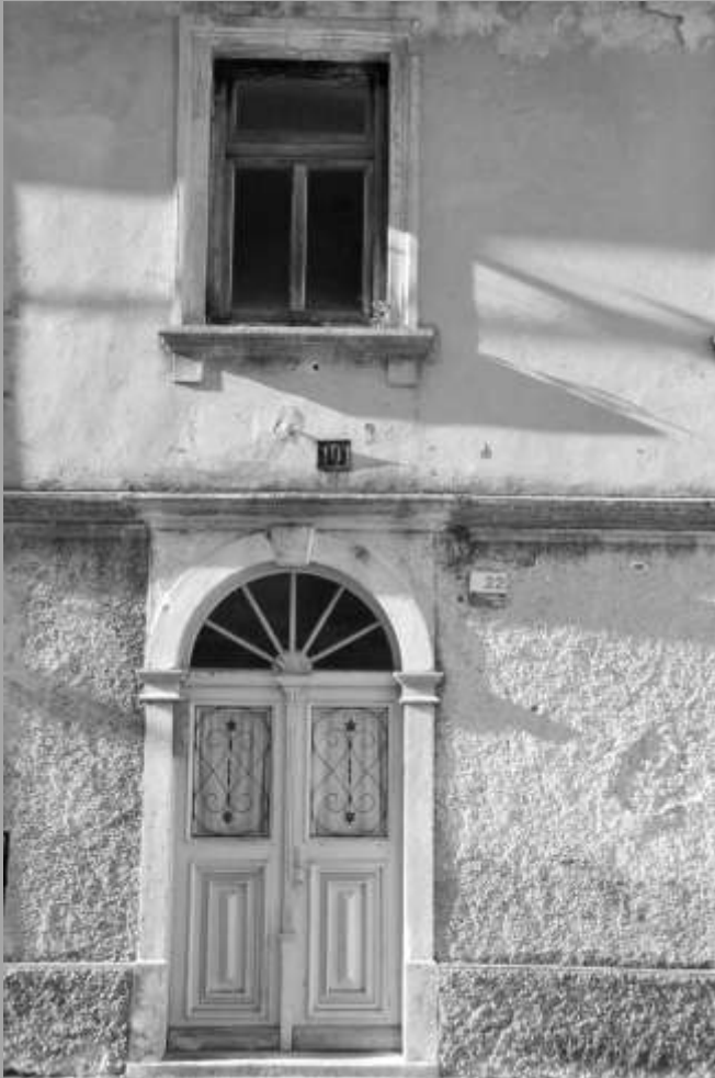
Jutro v Vipavi