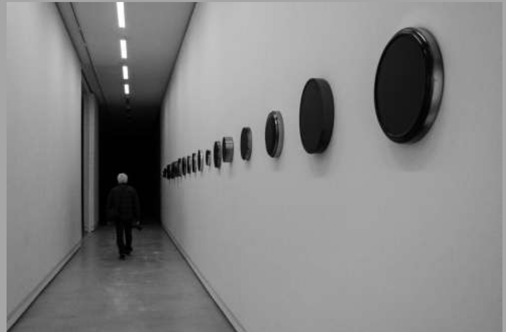
Črno - belo