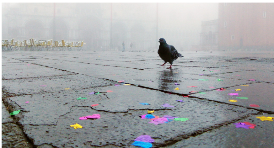
Danila Bricelj, Golob in konfeti