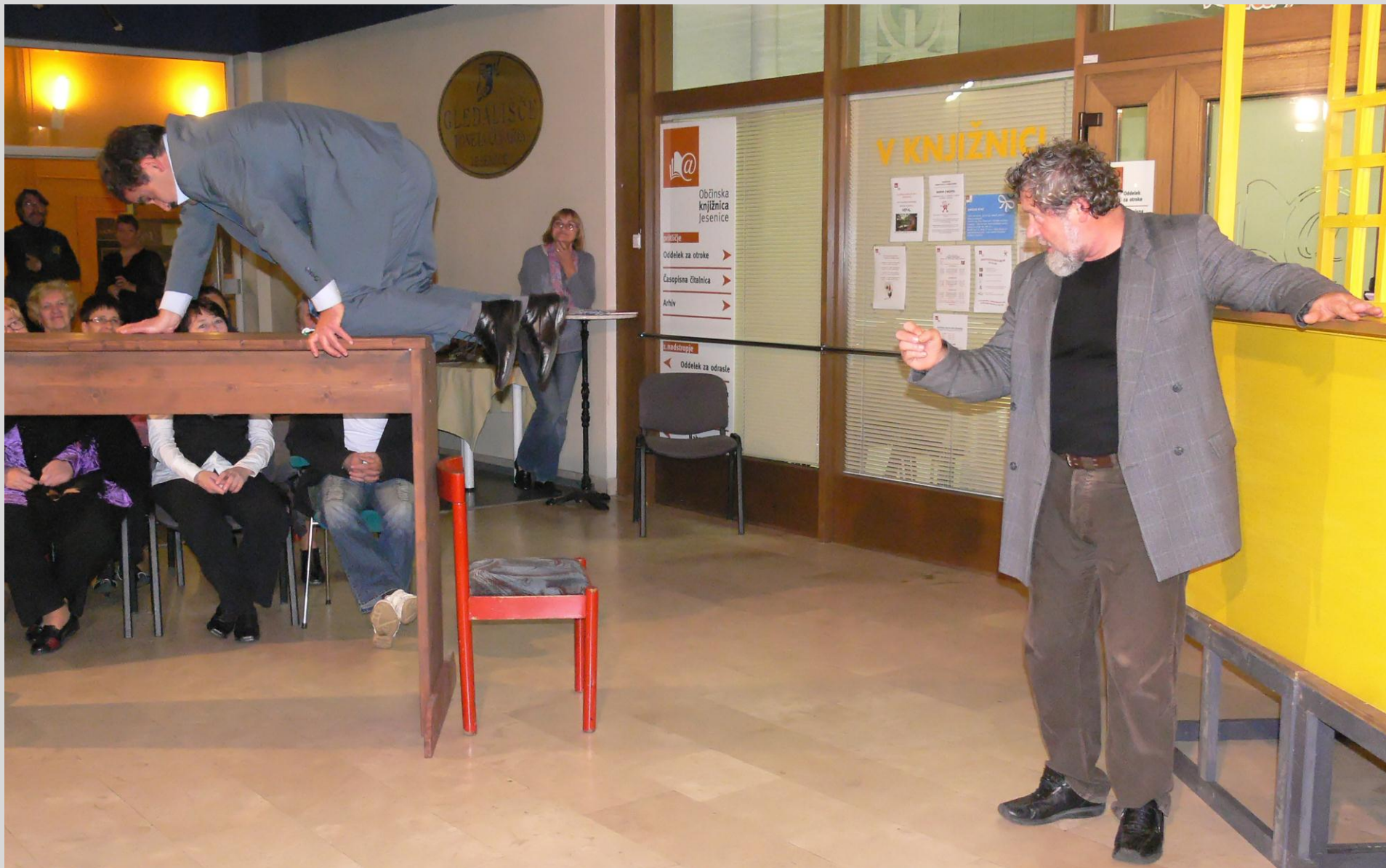
Spremljevalna predstava »Pr'šparan jur« - GTČ Jesenice