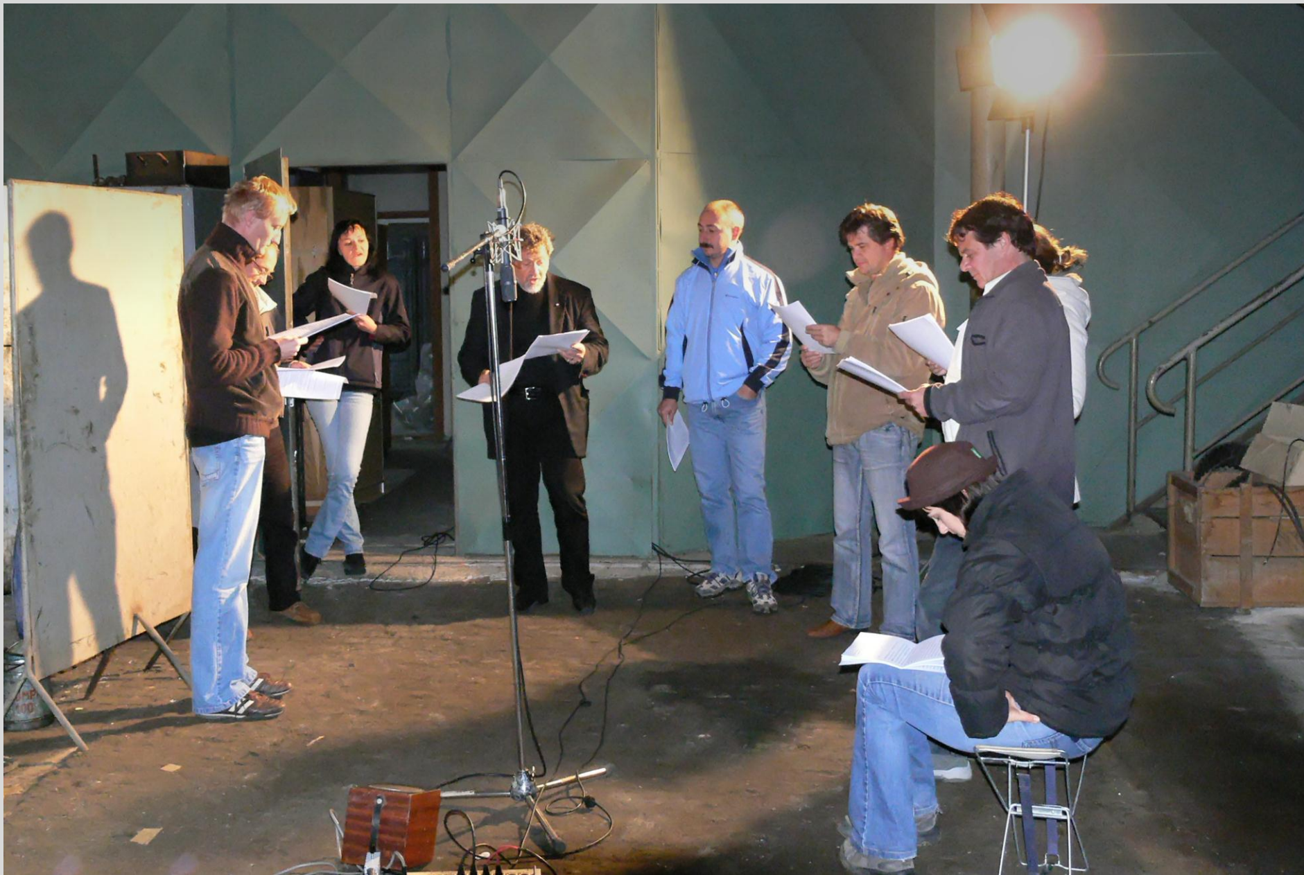
Snemanje drame Toneta Čufarja- Polom, za 1. program radia Slovenija – GTČ in radio ARS