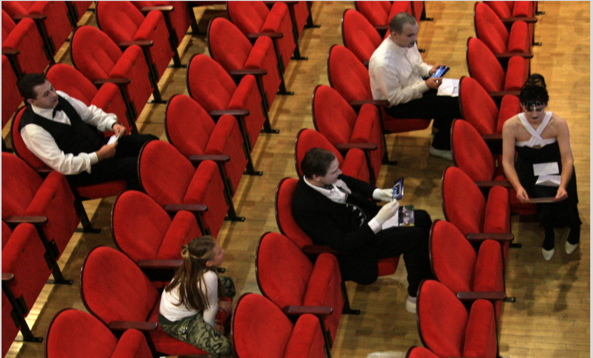
Koncentracija pred nastopom