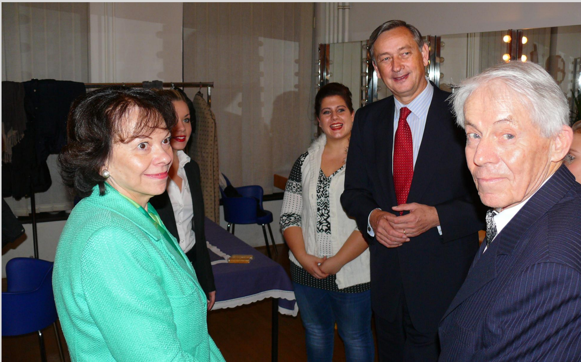
Predsednik republike, prva dama in predsednik org. odb. ČD med igralci