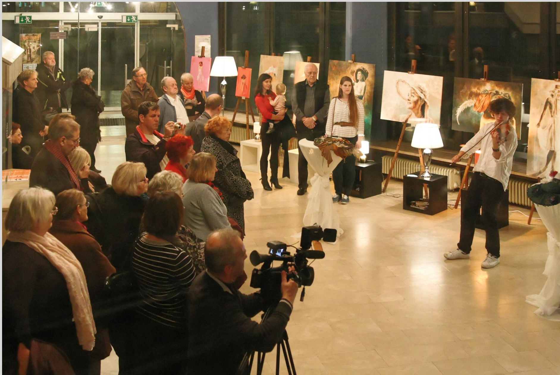
Spremljevalna prireditev – slikarska razstava »Klobuki«