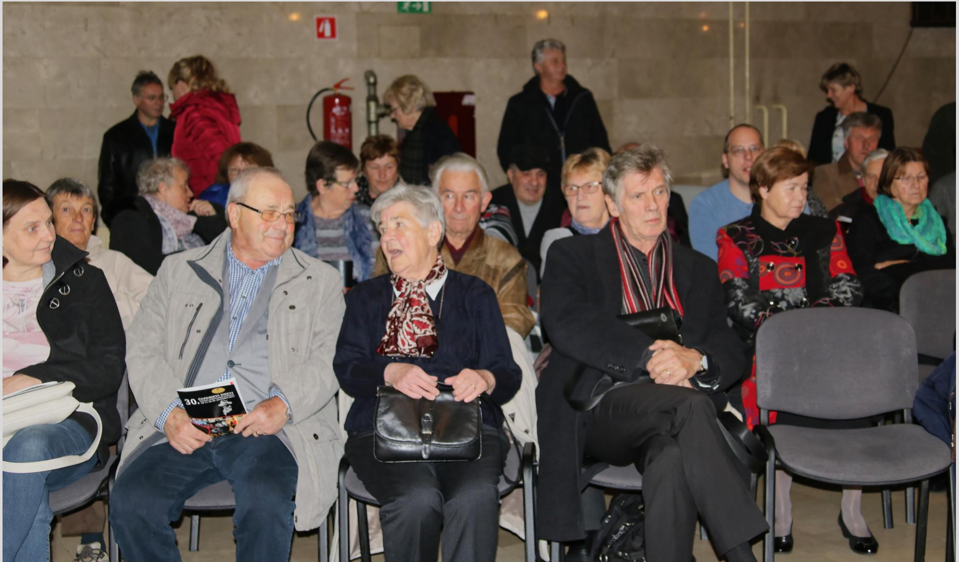
Spremljevalna prireditev »Jeseniški igralci« - GMJ