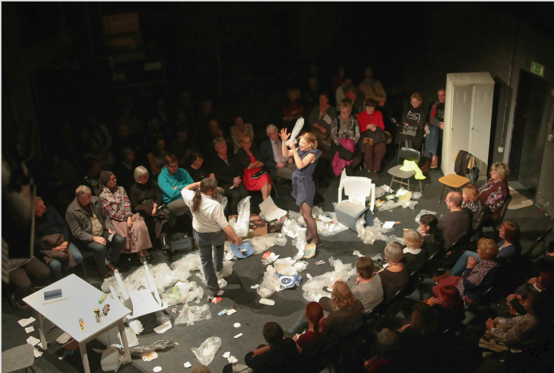
Predstavo KOS so gledalci spremljali na odru