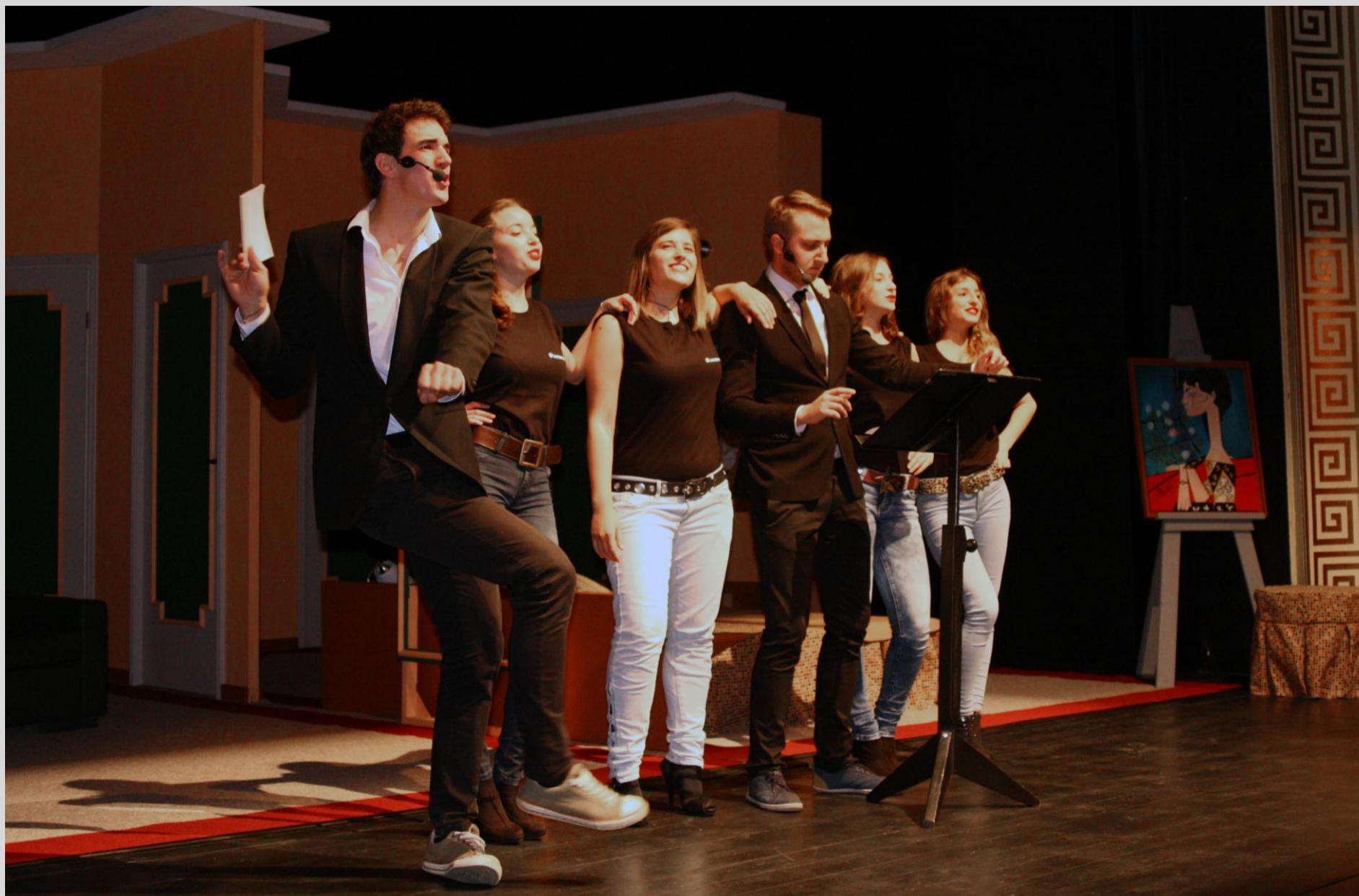
Spremljevalna prireditev »Reklame« -Mladinska skupina VI2 pri GTČ