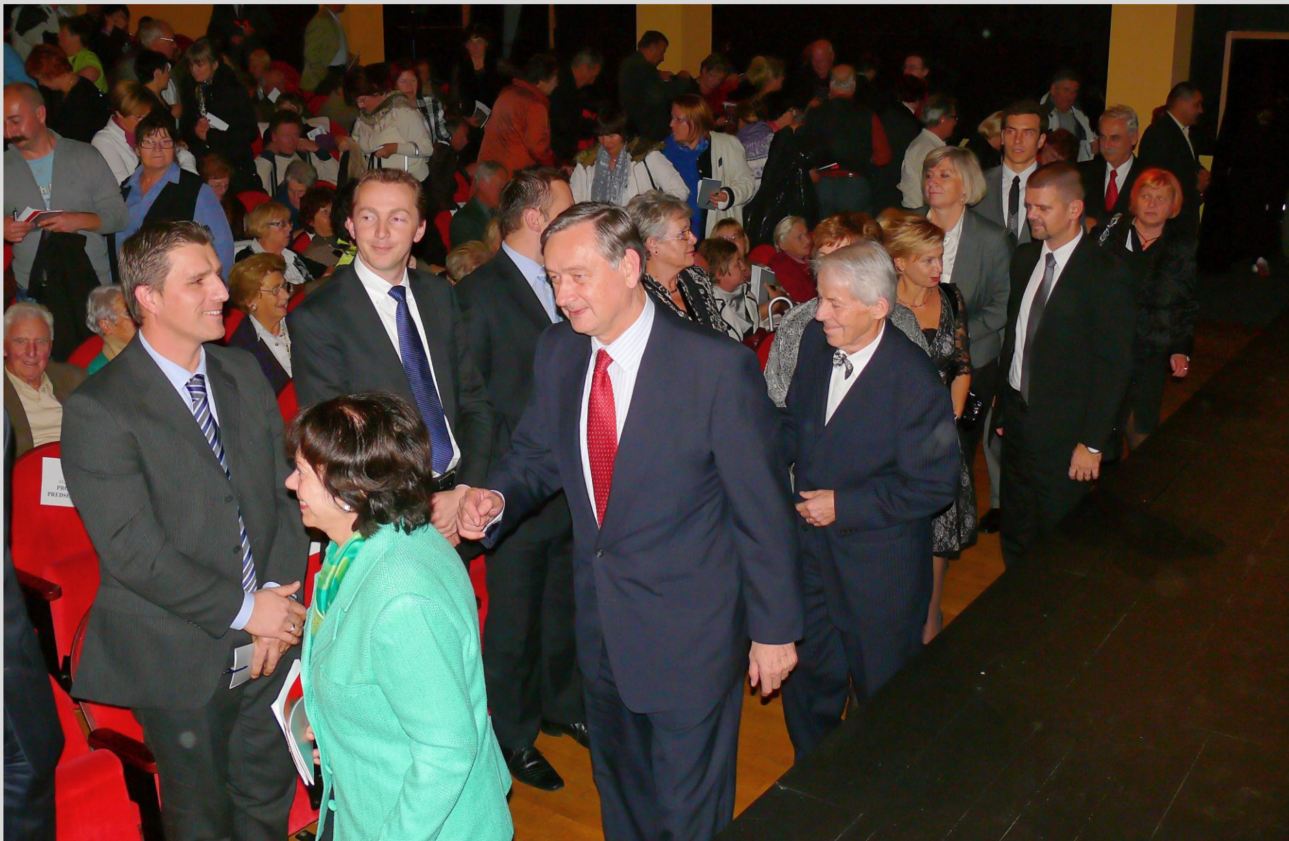
Častni govorec, predsednik republike g. Danilo Türk s soprogo