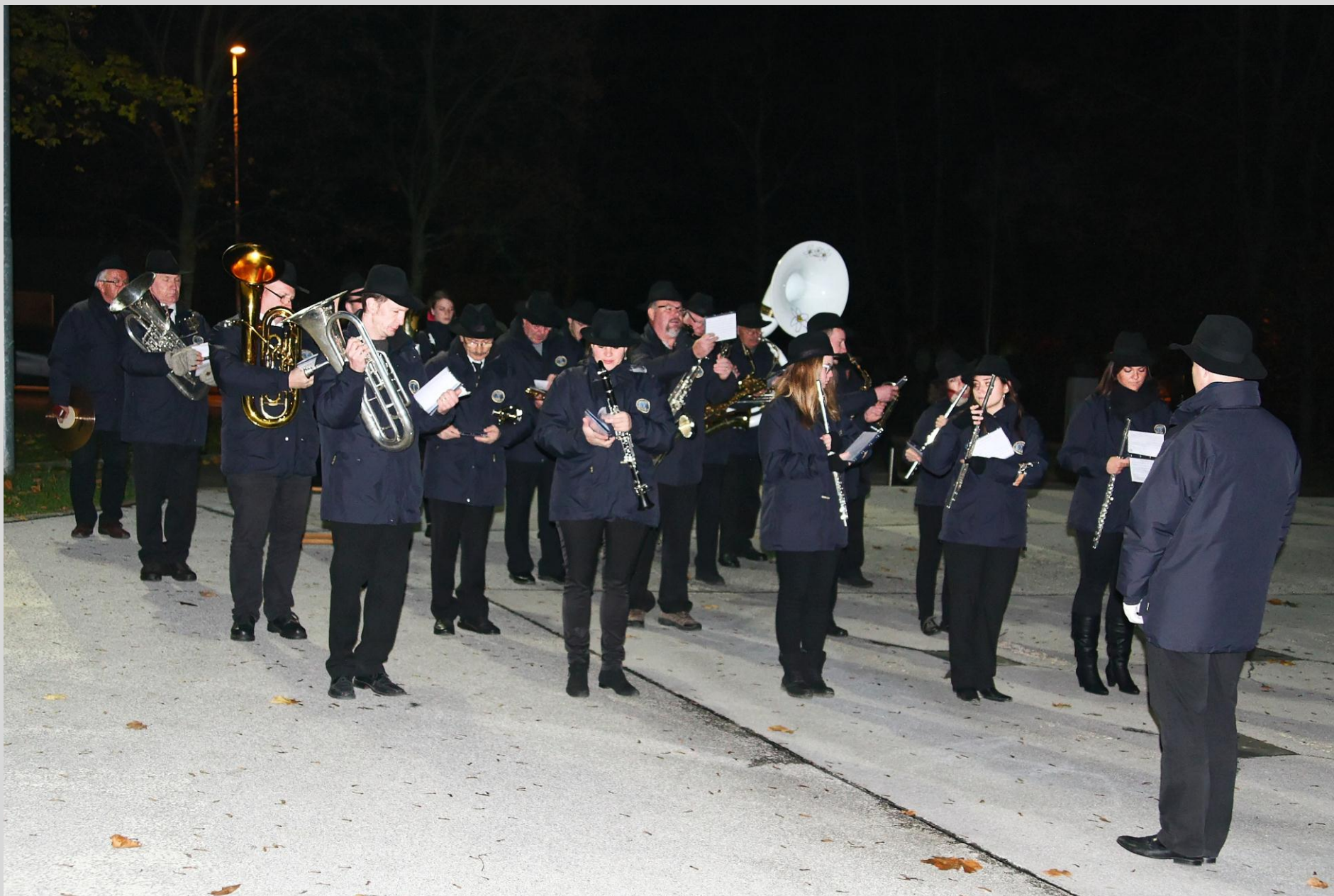
Vsakoletni koncert godbe na pihala Jesenice - Kranjska gora