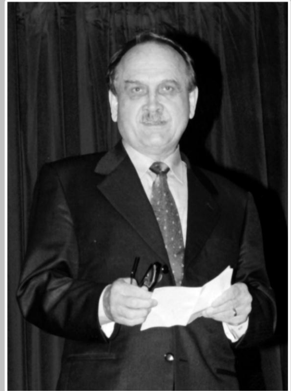
g. Matjaž Kmecl