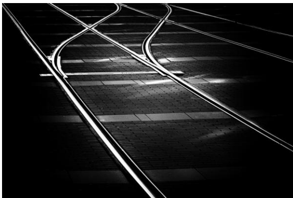
Stane Vidmar 2. Tir 1. nagrada